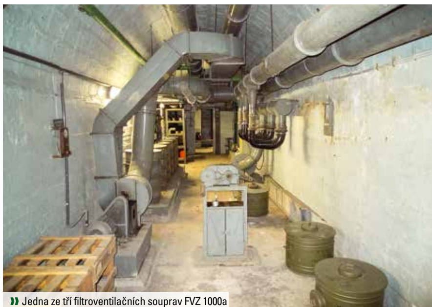
» Jedna ze tří filtroventilačních souprav FVZ 1000a

V souvislosti s jadernou hrozbou a změnou zahraniční politiky státu po roce 1948 bylo rozhodnuto o modernizaci stávajícího úkrytu na Folimance, aby odpovídal soudobým požadavkům. Jedná se o klasický štolový úkryt se dvěma vchody, které v potřebné hloubce příčně propojují další dvě chodby široké asi 2,5 m o délce 125 m, na něž jsou napojeny další místnosti a technologické zázemí. Nouzový východ ústí do Bělehradské ulice. Kromě něj byl úkryt vybaven i nouzový-