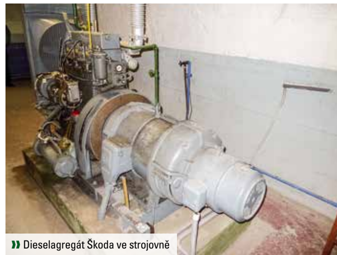
» Dieselaagregát Škoda ve strojovně

V objektu je vybudována i stálá expozice, která prostřednictvím fotografií a map představuje další velké úkryty na území hlavního města Prahy. Jedná se například o úkryty v ulicích Wassermannova, Generála Janouška, Bryxova, Thámová (tunel z Karlína na Žižkov), Na Topolce, Prokopova (úkryt Bezovka) a Keplerova. Drobná výstavka se týká například záplav a povodní, jež postihly Prahu v průběhu dvou posledních století. Zahrnuje také ukázky opatření proti povodním včetně skládacích hliníkových stěn a pomůcky ke snadnějšímu plnění pytlů s pískem. Přímou připomínkou bombardování Prahy v únoru 1945 v rámci výstavy „Popel“ vystavena 500liberní puma všeobecného použití GP AN-M43, darovaná Pyrotechnickou službou Policie ČR.