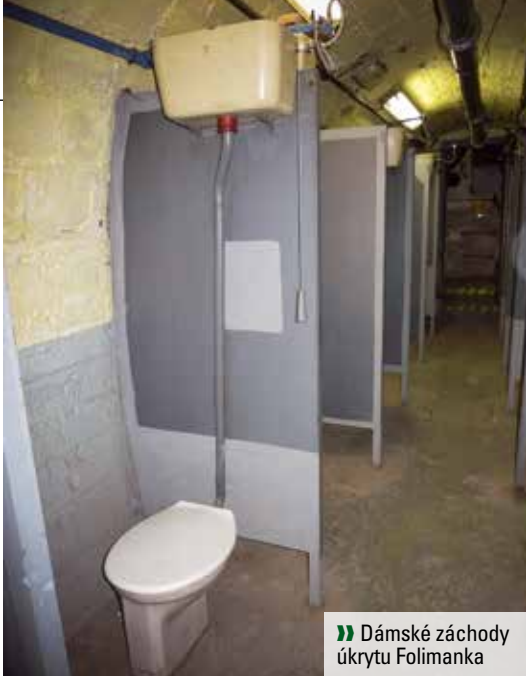
» Dámské záchody úkrytu Folimanka

a ve druhé se nacházejí dvě filtroventilační soustrojí FVZ 1000a typu 60/80.